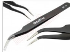
Pinza antiestática curva ESD-15