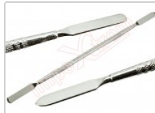
Espátula profesional de desmontaje para móviles y Smartphones