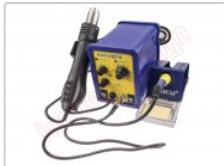
Estación doble de soldadura SMD, Baku 878

Para este manual necesitarás las siguientes herramientas y componentes que puedes adquirir en nuestra tienda on-line Impextrom.com Haz click encima de una herramienta para ir a la página web.