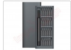
Destornillador alta calidad con 24 puntas de repuesto magnéticas 6024-C