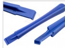
Herramienta plástica de apertura para dispositivos electrónicos