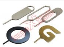
Herramienta de extracción de tarjeta SIM, 1 unidad