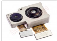
Cámara trasera de 48mpx/5mpx para oppo reno, cph1917

Para este manual necesitarás las siguientes herramientas y componentes que puedes adquirir en nuestra tienda on-line Impextrom.com Haz click encima de una herramienta para ir a la página web.