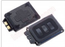
Altavoz tono llamada / buzzer para varios dispositivos Samsung

Para este manual necesitarás las siguientes herramientas y componentes que puedes adquirir en nuestra tienda on-line Impextrom.com Haz click encima de una herramienta para ir a la página web.