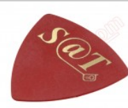
Púa especial SAT de 0.75mm de PVC de alta fricción