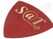
Púa especial SAT de 0.75mm de PVC de alta fricción