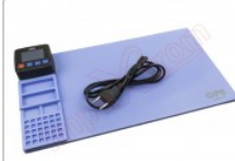
Tapete térmico de apertura mediante calor, CPB320