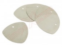
Conjunto de 5 púas metálicas para apertura de dispositivos