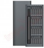
Destornillador alta calidad con 24 puntas de repuesto magnéticas 6024-C