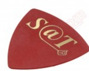
Púa especial SAT de 0.75mm de PVC de alta fricción