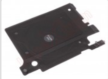
Antena nfc y carga inalámbrica para Samsung Galaxy s10 plus (sm-g975f)

Para este manual necesitarás las siguientes herramientas y componentes que puedes adquirir en nuestra tienda on-line Impextrom.com Haz click encima de una herramienta para ir a la página web.