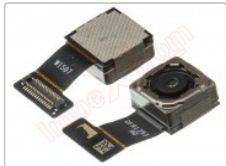
Cámara trasera de 8mpx para Xiaomi redmi go

Para este manual necesitarás las siguientes herramientas y componentes que puedes adquirir en nuestra tienda on-line Impextrom.com Haz click encima de una herramienta para ir a la página web.