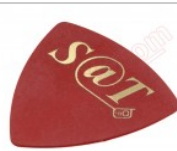
Púa especial SAT de 0.75mm de PVC de alta fricción