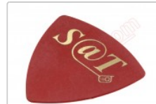
Púa especial SAT de 0.75mm de PVC de alta fricción