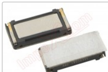
Altavoz auricular genérico de 12.06 x 6.22 x 2.47 mm