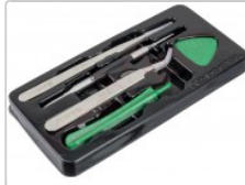
Kit BK-7285 de 5 herramientas apertura para smartphones