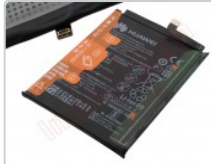
Batería hb436486ecw para Huawei mate 10 / mate 10 pro / p20 pro

Para este manual necesitarás las siguientes herramientas y componentes que puedes adquirir en nuestra tienda on-line Impextrom.com Haz click encima de una herramienta para ir a la página web.