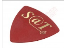
Púa especial SAT de 0.75mm de PVC de alta fricción