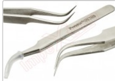
Pinzas puntas curvas profesional