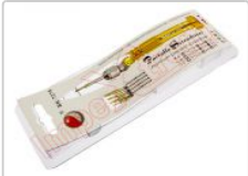
Destornillador de precisión BK-7275 con 5 puntas intercambiables

Para este manual necesitarás las siguientes herramientas y componentes que puedes adquirir en nuestra tienda on-line Impextrom.com Haz click encima de una herramienta para ir a la página web.