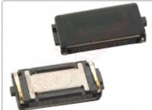
Altavoz auricular genérico de 12.98 x 6.01 x 2.05 mm