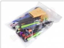
Conjunto de herramientas profesionales apertura de