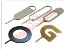
Herramienta de extracción de tarjeta SIM, 1 unidad

Para este manual necesitarás las siguientes herramientas y componentes que puedes adquirir en nuestra tienda on-line Impextrom.com Haz click encima de una herramienta para ir a la página web.