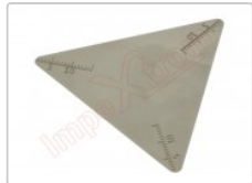
Herramienta metálica de apertura ultrathin de 0.1mm

Para este manual necesitarás las siguientes herramientas y componentes que puedes adquirir en nuestra tienda on-line Impextrom.com Haz click encima de una herramienta para ir a la página web.