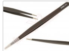
Pinzas ultrafinas rectas ESD-11