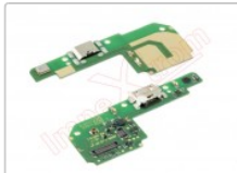
Placa auxiliar premium con componentes para Xiaomi redmi 6