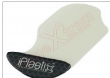
Herramienta plástica de apertura profesional iPlastix