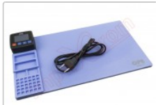
Tapete térmico de apertura mediante calor, CPB320

Para este manual necesitarás las siguientes herramientas y componentes que puedes adquirir en nuestra tienda on-line Impextrom.com Haz click encima de una herramienta para ir a la página web.