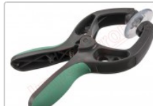
Ventosa para separar pantallas en general