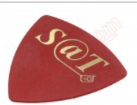
Púa especial SAT de 0.75mm de PVC de alta fricción