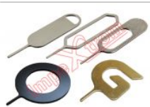
Herramienta de extracción de tarjeta SIM, 1 unidad