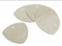
Conjunto de 5 púas metálicas para apertura