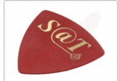
Púa especial SAT de 0.75mm de PVC de alta fricción