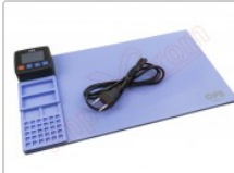
Tapete térmico de apertura mediante calor, CPB320