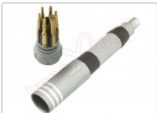
Destornillador 6 en 1, K-8107 con diferentes cabezales, en blíster