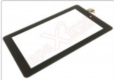
Pantalla táctil negra, Tablet Amazon Fire 7"

Para este manual necesitarás las siguientes herramientas y componentes que puedes adquirir en nuestra tienda on-line Impextrom.com Haz click encima de una herramienta para ir a la página web.