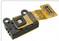
Conector audio jack 3.5 mm para sony xperia xa2, h3113

Para este manual necesitarás las siguientes herramientas y componentes que puedes adquirir en nuestra tienda on-line Impextrom.com Haz click encima de una herramienta para ir a la página web.