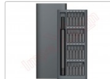
Destornillador alta calidad con 24 puntas de repuesto magnéticas 6024-C