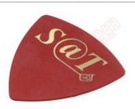
Púa especial SAT de 0.75mm de PVC de alta fricción