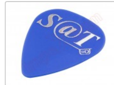
Púa especial SAT 0,70mm PET de alta fricción y resistencia