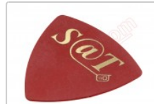
Púa especial SAT de 0.75mm de PVC de alta fricción