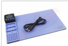
Tapete térmico de apertura mediante calor, CPB320

Para este manual necesitarás las siguientes herramientas y componentes que puedes adquirir en nuestra tienda on-line Impextrom.com Haz click encima de una herramienta para ir a la página web.