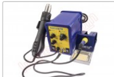
Estación doble de soldadura SMD, Baku 878