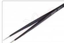
Pinza antiestática ESD redondeada