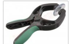
Ventosa para separar pantallas en general