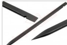
Herramienta Plástica Profesional de Apertura para Móviles