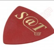
Púa especial SAT de 0.75mm de PVC de alta fricción