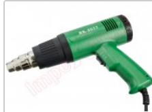
Pistola decapadora, soldador de aire caliente para reparaciones