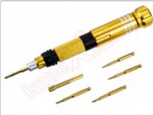
Kit de destornillador profesional y 6 puntas BST-8927B