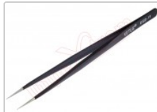
Pinza antiestática ESD redondeada