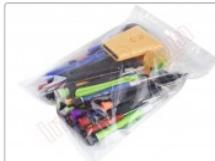
Conjunto de herramientas profesionales apertura de