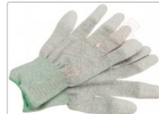
Guante ESD táctil para protección antiestática, talla S