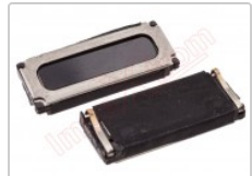
Altavoz auricular genérico de 15.02 x 6.05 x 2.55 mm