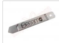
Herramienta metálica de apertura profesional iSesamo