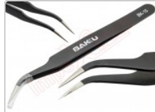
Pinza antiestática curva ESD-15