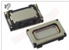
Altavoz auricular cubot note plus, cubot x18