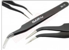
Pinza antiestática curva ESD-15