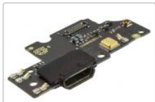
Placa auxiliar de calidad premium con componentes para bq aquaris u2 / bq