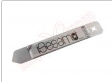
Herramienta metálica de apertura profesional iSesamo