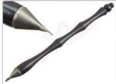
Herramienta apertura con cabezal de acero al carbono y mango de titanio

Para este manual necesitarás las siguientes herramientas y componentes que puedes adquirir en nuestra tienda on-line Impextrom.com Haz click encima de una herramienta para ir a la página web.