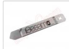
Herramienta metálica de apertura profesional iSesamo