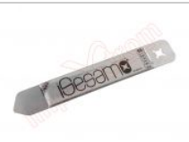
Herramienta metálica de apertura profesional iSesamo