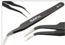
Pinza antiestática curva ESD-15

Para este manual necesitarás las siguientes herramientas y componentes que puedes adquirir en nuestra tienda on-line Impextrom.com Haz click encima de una herramienta para ir a la página web.