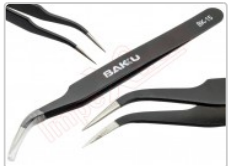
Pinza antiestática curva ESD-15

Para este manual necesitarás las siguientes herramientas y componentes que puedes adquirir en nuestra tienda on-line Impextrom.com Haz click encima de una herramienta para ir a la página web.