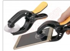
Ventosa para separar pantallas en smartphones