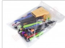
Conjunto de herramientas profesionales apertura de