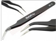
Pinza antiestática curva ESD-15

Para este manual necesitarás las siguientes herramientas y componentes que puedes adquirir en nuestra tienda on-line Impextrom.com Haz click encima de una herramienta para ir a la página web.