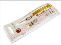
Destornillador de precisión BK-7275 con 5 puntas intercambiables