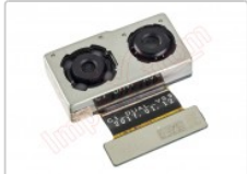
Cámara trasera dual de 12 mpx para Xiaomi mi6

Para este manual necesitarás las siguientes herramientas y componentes que puedes adquirir en nuestra tienda on-line Impextrom.com Haz click encima de una herramienta para ir a la página web.