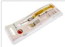
Destornillador de precisión BK-7275 con 5 puntas intercambiables

Para este manual necesitarás las siguientes herramientas y componentes que puedes adquirir en nuestra tienda on-line Impextrom.com Haz click encima de una herramienta para ir a la página web.