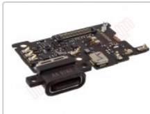
Placa auxiliar premium con componentes para Xiaomi mi6 (mce16).