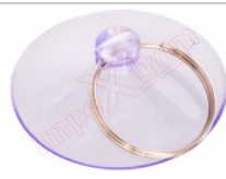
Ventosa de succión para desmontar y reparar