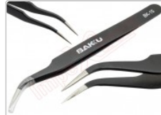
Pinza antiestática curva ESD-15