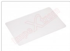
Herramienta tarjeta de plástico flexible para apertura de dispositivos