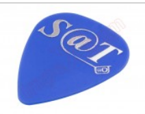
Púa especial SAT 0,70mm PET de alta fricción y resistencia