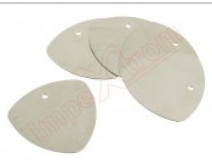
Conjunto de 5 púas metálicas para apertura de dispositivos