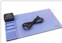
Tapete térmico de apertura mediante calor, CPB320