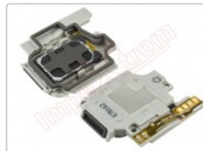
Altavoz tono de llamada para Samsung Galaxy j5 (2017), j530f