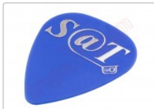
Púa especial SAT 0,70mm PET de alta fricción y resistencia