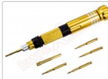
Kit de destornillador profesional y 6 puntas BST-8927B