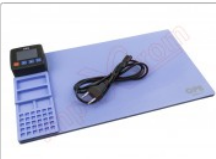
Tapete térmico de apertura mediante calor, CPB320