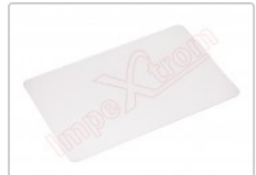
Herramienta tarjeta de plástico flexible para apertura de dispositivos