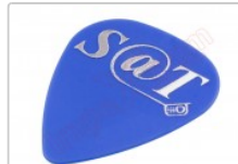
Púa especial SAT 0,70mm PET de alta fricción y resistencia