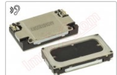
Altavoz auricular genérico de 16 x 9 mm