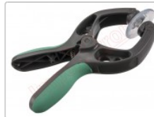
Ventosa para separar pantallas en general