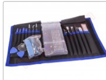
Kit de herramientas profesional 70 en 1