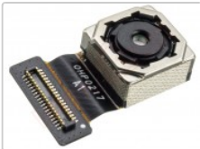
Cámara trasera de 13mpx nokia 5, ta-1053 ds

Para este manual necesitarás las siguientes herramientas y componentes que puedes adquirir en nuestra tienda on-line Impextrom.com Haz click encima de una herramienta para ir a la página web.