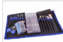
Kit de herramientas profesional 70 en 1