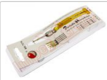
Destornillador de precisión BK-7275 con 5 puntas intercambiables