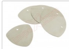
Conjunto de 5 púas metálicas para apertura de dispositivos

Para este manual necesitarás las siguientes herramientas y componentes que puedes adquirir en nuestra tienda on-line Impextrom.com Haz click encima de una herramienta para ir a la página web.