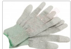
Guante ESD táctil para protección antiestática, talla S