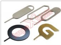
Herramienta de extracción de tarjeta SIM, 1 unidad