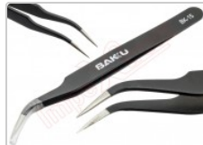
Pinza antiestática curva ESD-15