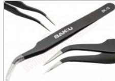
Pinza antiestática curva ESD-15