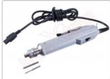
Destornillador eléctrico profesional de precisión

Para este manual necesitarás las siguientes herramientas y componentes que puedes adquirir en nuestra tienda on-line Impextrom.com Haz click encima de una herramienta para ir a la página web.