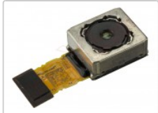
Cámara trasera de 23mpx para sony xperia xa1, g3121 (1307-3267)

Para este manual necesitarás las siguientes herramientas y componentes que puedes adquirir en nuestra tienda on-line Impextrom.com Haz click encima de una herramienta para ir a la página web.