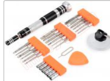
Kit de destornillador JM-8142 con 24 puntas y herramientas apertura