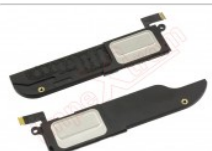
Altavoces iPad mini 4