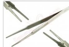
Pinza antiestática recta redondeada