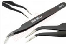
Pinza antiestática curva Baku ESD BK-15