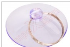
Ventosa de succión para desmontar y reparar smartphones y tablets, pantallas