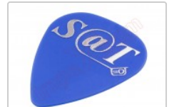
Púa especial SAT 0,70mm PET politereftalato de etileno de alta fricción