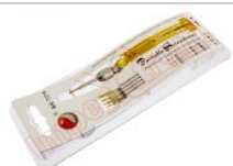
Destornillador 5 en 1 BK-7275