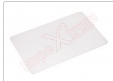
Herramienta tarjeta de plástico flexible para apertura de dispositivos