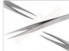
Pinzas profesionales punta fina, ST-10