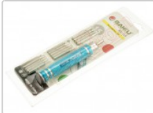
Destornillador BK-315 15 en 1 para Móviles y Tablets