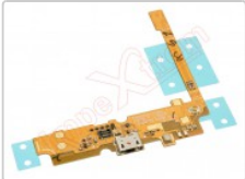
Flex con conector de carga y accesorios microusb lg l70, d320n, l65, d280n

Para este manual necesitarás las siguientes herramientas y componentes que puedes adquirir en nuestra tienda on-line Impextrom.com Haz click encima de una herramienta para ir a la página web.