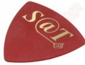
Púa especial SAT de 0.75mm de PVC de alta fricción