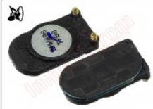
Altavoz tono de llamada genérico para dispositivos lg

Para este manual necesitarás las siguientes herramientas y componentes que puedes adquirir en nuestra tienda on-line Impextrom.com Haz click encima de una herramienta para ir a la página web.