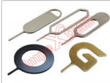
Herramienta de extracción de tarjeta SIM