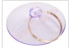
Ventosa de succión para desmontar y reparar smartphones y tablets, pantallas