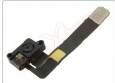
Cámara frontal de 1.2Mpx tablet iPad mini retina, ipad mini 2, iPad A1823 de 9.7

Para este manual necesitarás las siguientes herramientas y componentes que puedes adquirir en nuestra tienda on-line Impextrom.com Haz click encima de una herramienta para ir a la página web.