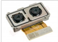
Cámara trasera dual de 20mpx + 12mpx Huawei mate 9, mha-l29

Para este manual necesitarás las siguientes herramientas y componentes que puedes adquirir en nuestra tienda on-line Impextrom.com Haz click encima de una herramienta para ir a la página web.