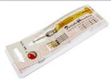
Destornillador de precisión BK-7275 con 5 puntas intercambiables